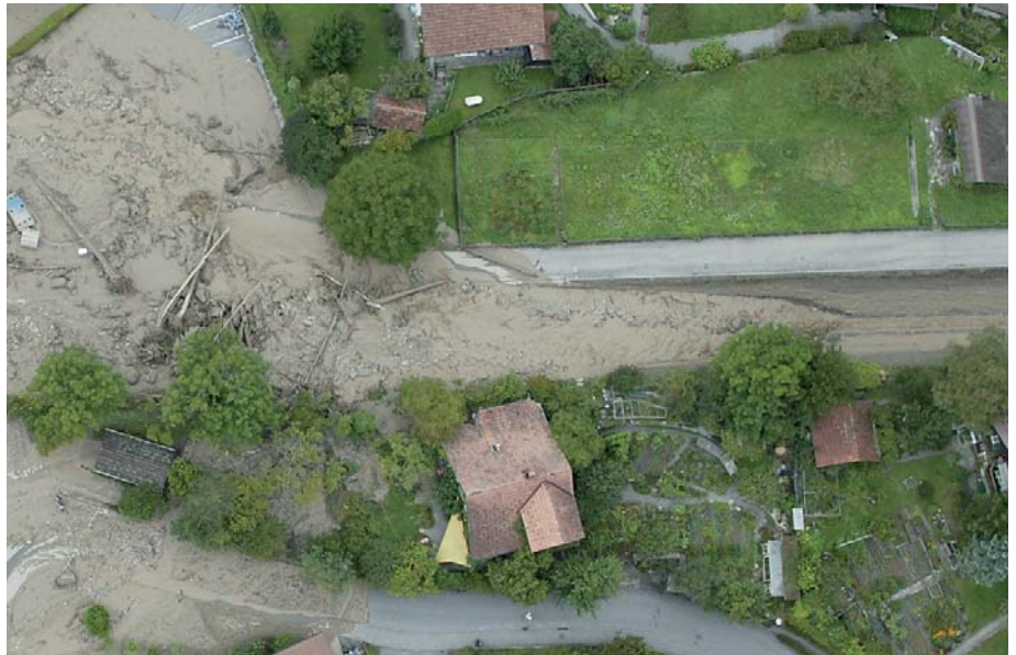
Abb. 1: Bilder hoher Auflösung erlauben die genaue Rekonstruktion der beteiligten Prozesse.

Wie die allgemein bekannt gewordenen Bilder aus Brienz zeigen, sind in den Berg-