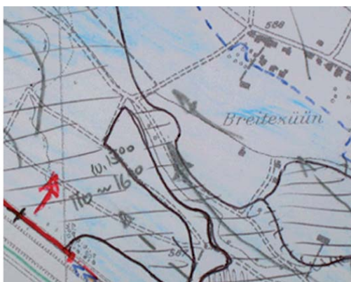
Abb. 6: Provisorische Handskizze für die Ereignisdokumentation am Beispiel des Aaredammbuchs bei Meiringen.