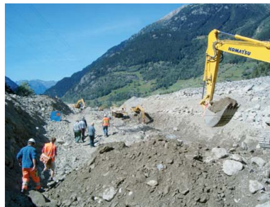
Abb. 4: Um in den Ablagerungsbergen die Übersicht zu behalten, müssen gute geometrische Grundlagen zur Verfügung stehen.

Ein wichtiges Resultat bildet die Prozessraumkarte , die vom Oberingenieur Kreis I in Auftrag gegeben wurde. Ziel dieser Karten war eine flächige Darstellung der Prozessräume, aufgeteilt nach den Prozessarten Wasser, Murgang und Erosion (vereinfacht). Detailinformationen zu den einzelnen Prozessen wurden nicht nachgefragt. Mit Hilfe von Luftbildern vom 23. August 2005 konnten die betroffenen Flächen einfach und eindeutig identifiziert und erfasst werden, da die maximalen Wasserstände noch sehr deutlich sichtbar waren.