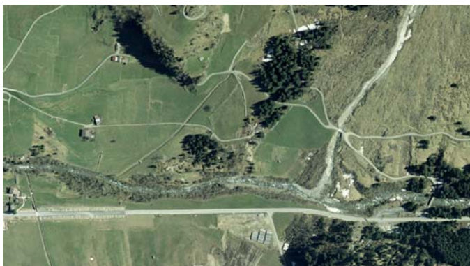
Abb. 2: Der Aarelauf und die Strasse oberhalb Guttannen vor dem Ereignis.

halten und das Dorf wurde am 22. August von der Aare überschwemmt. Als Sofortmassnahme musste für die Aare ein neues Bett gegraben und eine Notstrasse zur Sicherstellung des Zugangs zu den Kraftwerkenanlagen der KWO gebaut werden (Abb. 4). Nach der Befliegung vom 23. August wurden die Luftbilder noch in derselben Nacht orientiert und ausgewertet. Damit standen zur Planung und Ausführung dieser riesigen Erdarbeiten bereits am 24. August die photogrammetrischen Daten der neuen Topographie und die Mächtigkeit der Schuttablagerung bereit. Ähnliche Beispiele wären aus Brienz, dem Diemtig- und dem Lüttschental zu zeigen.